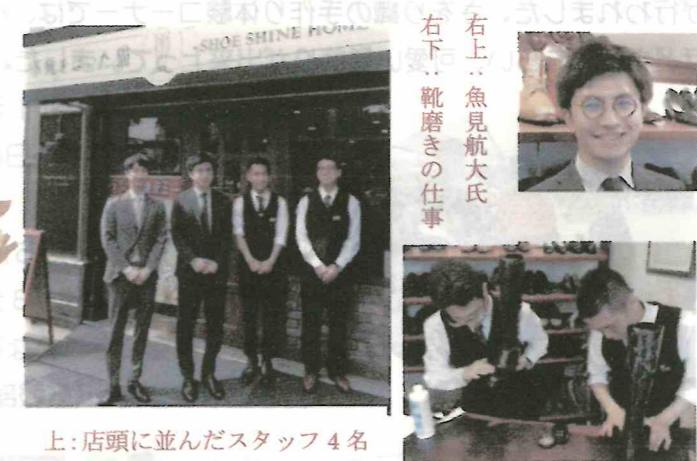
上：店頭に並んだスタッフ4名

【起業】 修行を経て、在学中に訪問型の靴磨きサービスで起業しました。カフェで共に働いていた知的障害者に、自分が身につけた靴磨きの技術を教えながら、共に靴磨き職人として働き始めました。最初は店舗がなく、企業を訪問し、預かった靴を専門技術でピッカピカに磨いて渡す形態でした。何よりお客さんの驚き喜ぶ顔が、みんなの大きな励みになりました。また、当社の取り組みがテレビでも紹介されました。そして2018年には京都市役所近くに店舗をオープン出来ました。