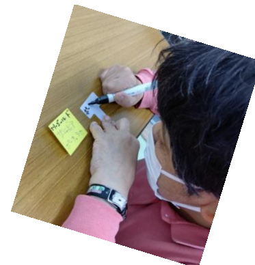
名札にお花の名前を書く