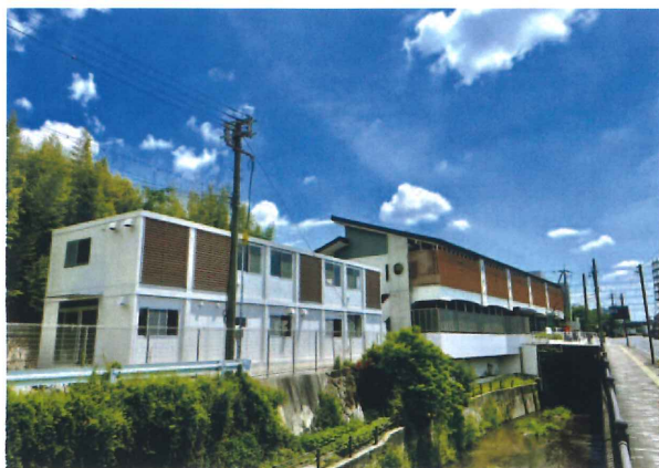
▲ かしの木工房 こはまに隣接しています